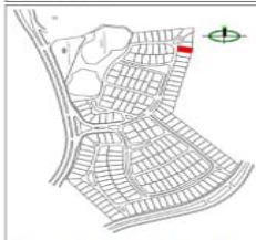
LOCALIZACIÓN DE LOTE DENTRO DEL CONDOMINIO

Paso de instalaciones de infraestructura interna En esta franja solo se permitira el sembrado de especies vegetales de raiz superficial