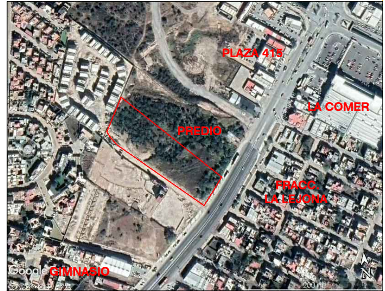
PREDIO SOBRE IMAGEN DE GOOGLE EARTH fecha de la imagen 12/2021, se anexa archivo KMZ